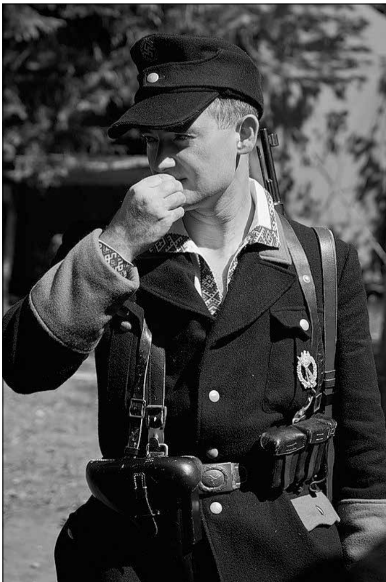
Беларускі паліцыянт, сучасная рэканструкцыя

Да таго ж вядомыя факты супрацоўніцтва АК з нямецкімі структурамі з мэтай змагання супраць савецкіх партызан на Лідчыне і Наваградчыне. Усё гэта аказалася даволі прагматычна. Бо тая раёны, дзе дзейнічала АК і не было савецкіх партызанаў, пацярпелі значна