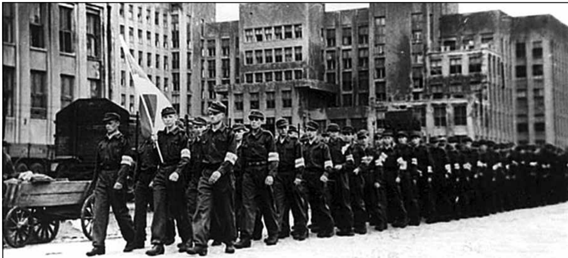
Выпускнікі камандзірскіх курсаў БКА падчас урачыстага маршу. Чэрвень 1944 года

— Беларускі нацыянальны рух быў тады не такім моцным і развітым, каб стварыць свае паліцэйскія сілы па ўсёй тэры-