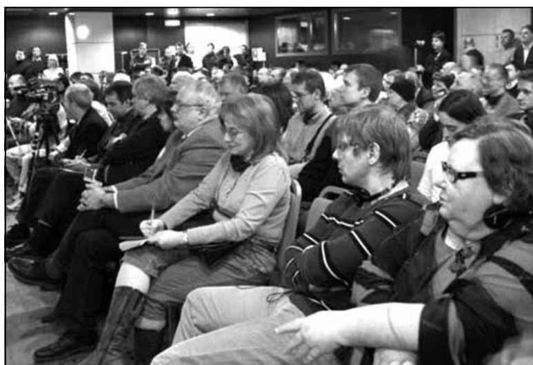
Падчас прэзентацыі кнігі Дзюкава, арганізаванай клубам «Импресум» у Таліне.

Як бачым, для аперацый уплыву Расіі ў краіне НАТО Эстоніі сфарміраваны выкшталцаваны і дасканалы механізм іх рэалізацыі — ад стварэння медыйнага прадукту да яго інфармацыйнай падтрымкі і пашырэння.