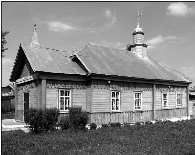
Мікалаеўская царква ў Крычаве.