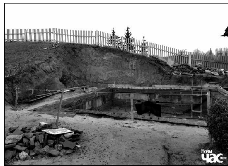
Знесеная частка вала пры будаўніцтве царкоўнай лаўкі

Прыведзеныя факты сведчаць, што тэрыторыя царквы ў цэнтры старой часткі Крычавы з’яўляецца гістарычным месцам, а будаўнічыя працы на такой тэрыторыі абавязкова павінны праводзіцца разам са спецыялістамі-гісторыкамі, а лепш — археолагамі, аднак гэтага не робіцца. Такім чынам, на сённяшні момант сур’ёзны культурны слой тэрыторыі Свята-Уваскрасенскай царквы належыць прафесійна даследаваць і толькі пасля гэтага, з дазволу спецыялістаў і адпаведных інстанцый, пачынаць будаўнічыя працы.