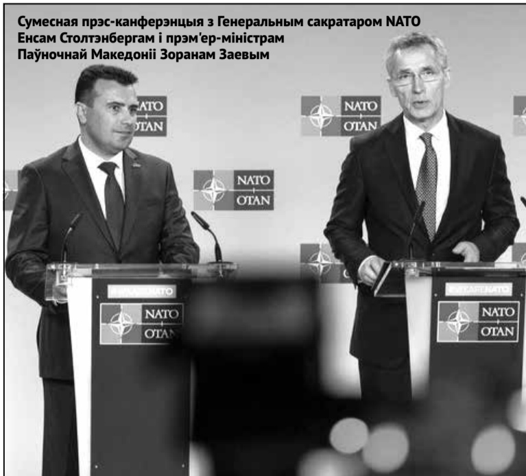
Сумесная прэс-канферэнцыя з Генеральным сакратаром НАТО Енсам Сталтэнбергам і прэм'ер-міністрам Паўночнай Македоніі Зоранам Заевым

Версія не паўстала на голым месцы. У гэтым балканскім рэгіёне гістарычна дзейнічалі балгарскія палітычныя рухі. Аднак так ці інакш, толькі 3 працэнты насельніцтва Паўночнай Македоніі (паводле апошняга перапісу) адносяць сябе да балгар. Зрэшты, у часы Ціта такіх увогуле практычна не было.