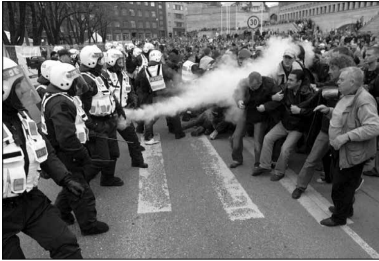
Масавыя беспарадкі ў Таліне, якія суправаджаліся пагромам і марадзёрствам, справакаваныя радыкаламі групойкі «Ночной дозор» у красавіку 2007 года падчас пераносу манументу так звананага «Брознавага жаўнера» на Вайсковы цвінтар

Амерыканскі пісьменнік і журналіст Піт Эрлі (Pete Earley) у сваёй кнізе «Comrade J — the untold secrets of Russia's master spy in America after the end of the Cold War» («Таварыш Дж. — невырашаныя таямніцы галоўнага расійскага шпіёна ў Амерыцы пасля заканчэння Халоднай вайны») падае сведчанні Сяргея Трацякова — афіцэра СЗВ РФ, які ў 2000 годзе перайшоў на бок ЗША. Паводле прызнанняў гэтага перабежніка, у 1990-х гадах у якасці карэспандэнтаў выдання «Комсомольская правда» за мяжой працавалі больш за дзесяць асобаў, з якіх толькі адзін не атрымліваў заробак у СЗВ. Гэты, адзін з асноўных расійскіх органаў знешняй выведкі, можа выкарыстоўваць агентурнае сеціва з прадстаўнікоў журналісцкага асяроддзя, каб атрымаць доступ да важных асобаў, а таксама садзейнічаць правядзенню супраць краіны прызначэння расійскай інфармацыйнай вайны.