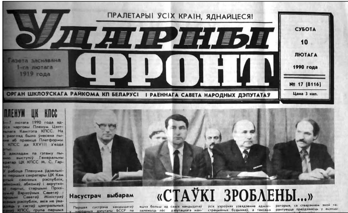
Шклоўская газета «Ударны фронт». Рэпартаж пра сустрэчу кандыдатаў у дэпутаты з выбаршчыкамі па Шклоўскай акрузе

Першы сапраўдны беларускі парламент запрацаваў 30 гадоў таму. Менавіта той склад Вярхоўнага Савета пераўтварыў БССР у Беларусь і абвясціў яе незалежнай. Менавіта з таго складу парламента выйшлі дасюль самыя папулярныя беларускія палітыкі, у тым ліку два кіраўнікі нашай краіны. Паколькі цяпер Вярхоўнага Савета няма, як, па вялікім рахунку, і парламента паводле яго сутнасці і прызначэння, тагачасны дэпутацкі склад можна назваць легендарным.