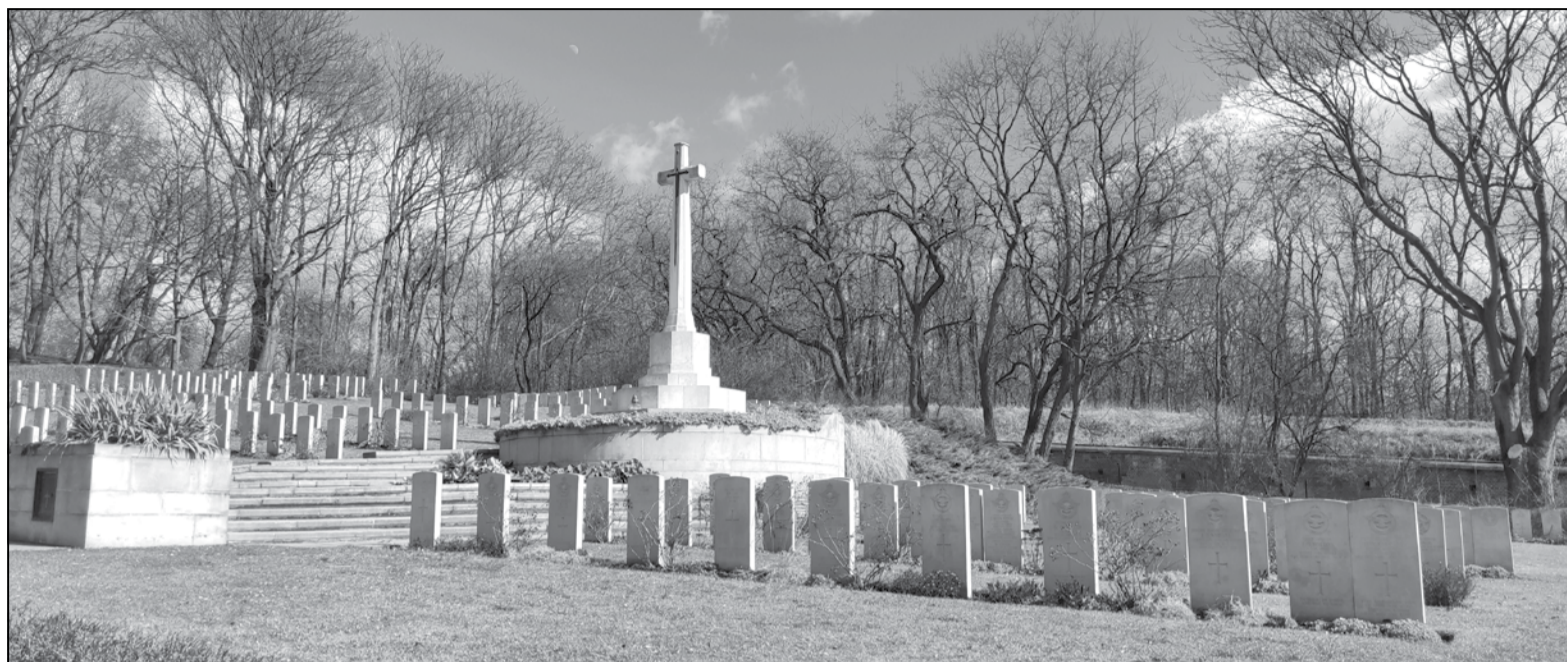
Брытанскія вайсковыя могілкі ў познанскай цытадэлі.

Па словах брытанцаў і французцаў, калі яны знаходзіліся ў савецкіх турмах у Беластоку, Мінску і Маскве, то пісалі лісты ў свае абмаданы, аднак гэтая