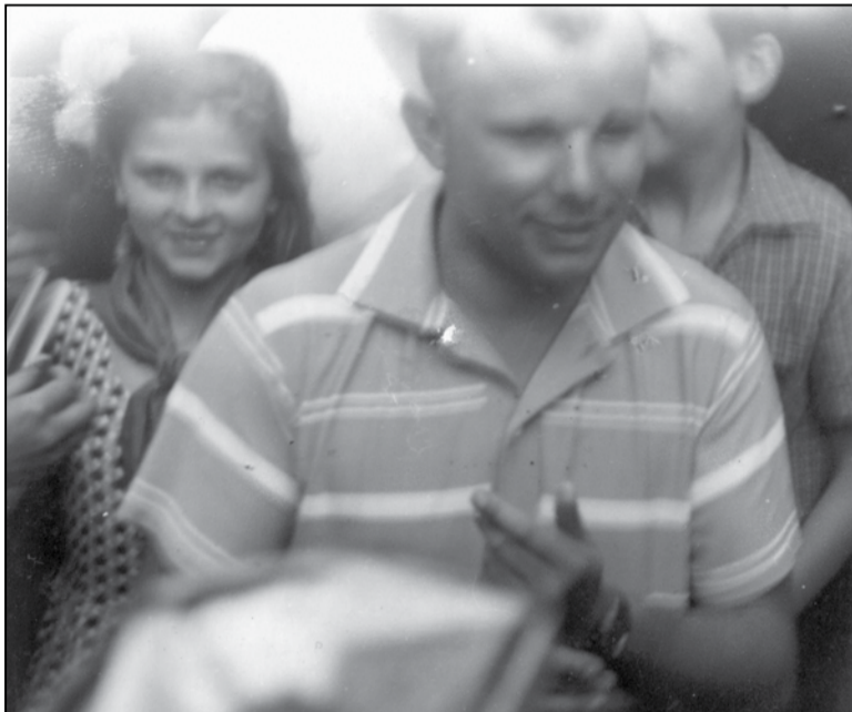
Невядомы фотаздымак Юрыя Гагарына

— Надакучыў ты, Гена, са сваёй Беларуссю! Маленькая яна ў ка-