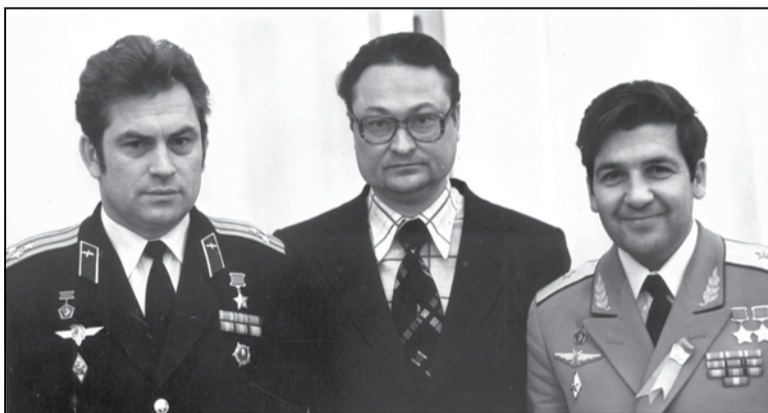
Генадзь Бураўкін з беларускімі касманаўтамі Уладзімірам Кавалёнкам (злева) і Пятром Клімуком.

смiчных маштабах, яе і з Масквы часам не відно.