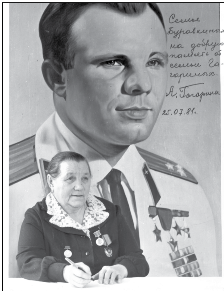
Дарчы надпіс маці Юрыя Гагарына Ганны Цімафееўны