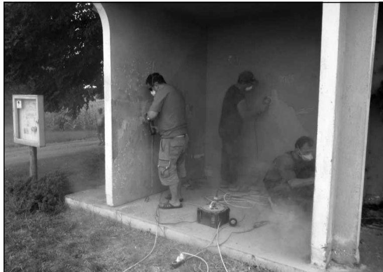
Пачатак працы на прыпынку

Адначасова краязнаўцы дапрацавалі эскіз краязнаўча-турыстычнага маршрута «Прынёманскімі шляхамі акадэміка Я.Карскага» з улікам новых гістарычных звестак.