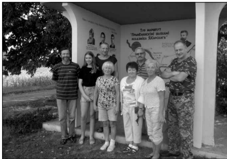
Агульнае фота пасля вечарыны, прысвечанай настаўніку Цыхуну