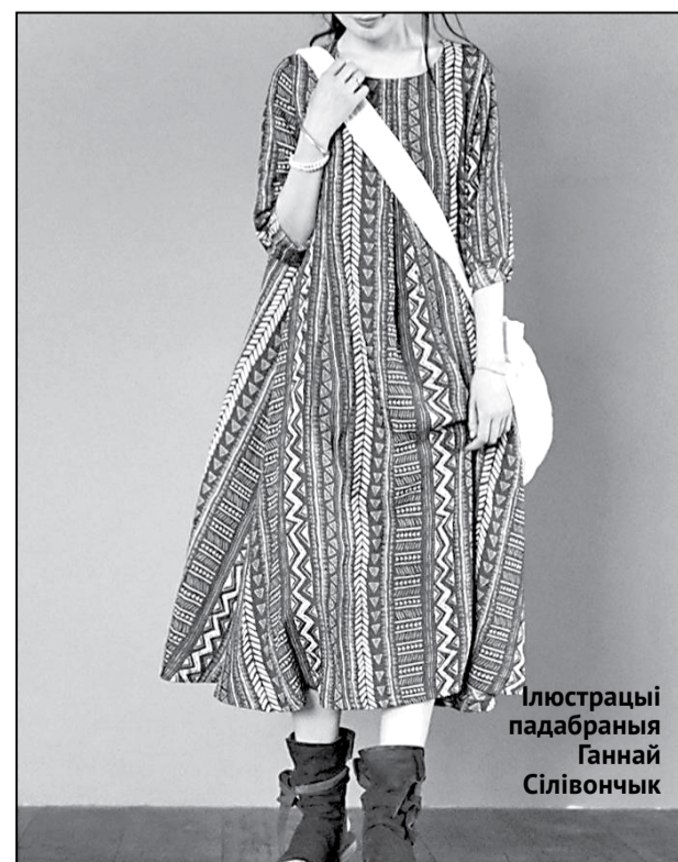
Ілюстрацыі падабраныя Ганнай Сілівончык