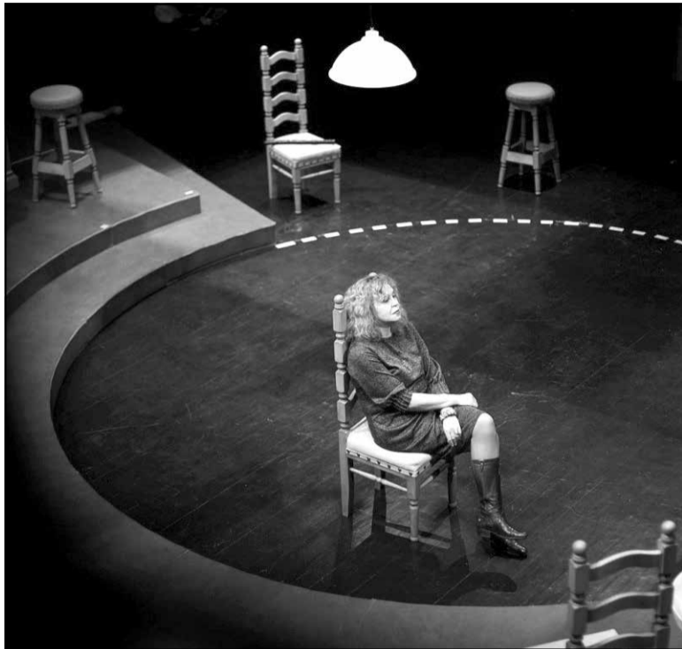
Вольга Бабкова.

— Калі б яе не было, я б не абрала такую тэму дыпломнай працы. Я любіла горад на падсвядомым узроўні. Гэтакі спрыялі мае бацькі. Хоць яны нарадзіліся не ў Мінску, але